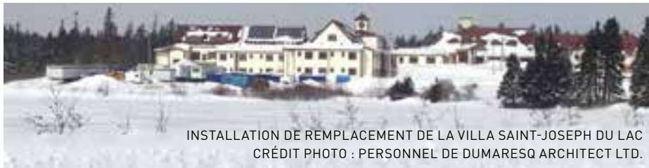
INSTALLATION DE REMPLACEMENT DE LA VILLA SAINT-JOSEPH DU LAC

Il y a du vrai dans l'adage « où le cœur aime, là est le foyer. » Ma maison d'enfance est l'endroit où je me suis toujours senti le plus à l'aise et, bien que je n'aie pas habité cette maison depuis des années, une simple odeur ou mélodie peut susciter en moi une forte nostalgie qui m'y ramène.